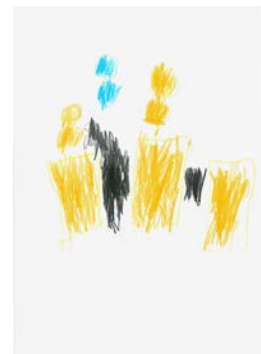
Der Polizist und der Zebra-streifen