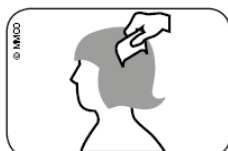
Abb. Durchkämmen des nassen Haares mit Läusekamm vom Haaransatz bis zu den Haarspitzen